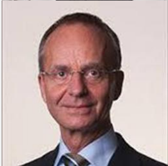
Henk Kamp Economische Zaken