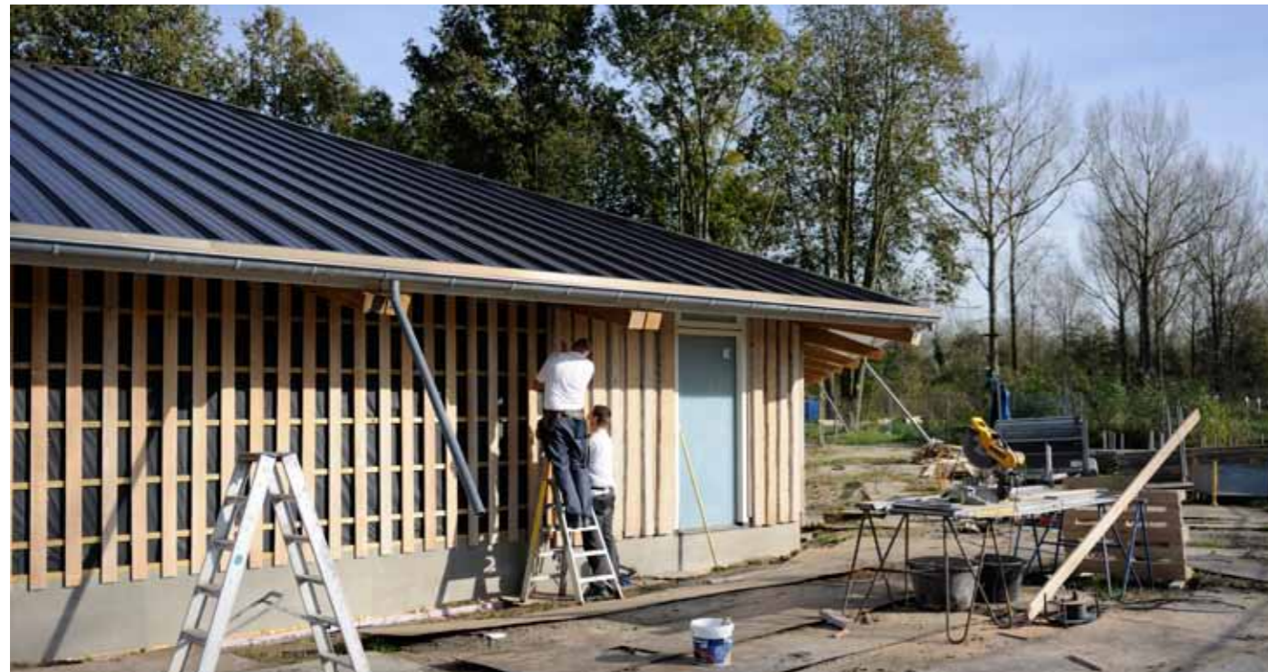
Buitencentrum Almeerderhout 4