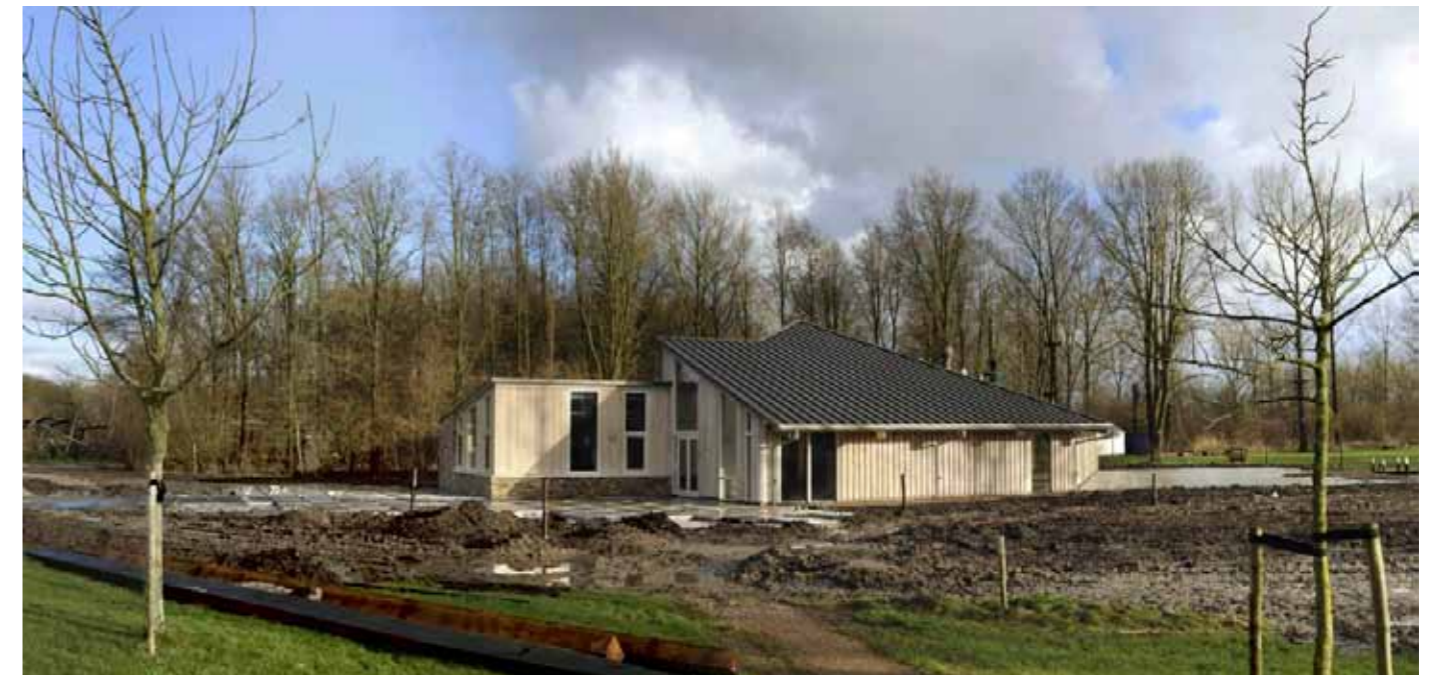
Buitencentrum Almeerderhout 5

Gekozen is voor bronskleurig aluminium. Door de wijze waarop de aluminium platen onderling zijn bevestigd, ontstaat een beeld dat aan bladnerven doet denken. Het is zo bevestigd dat het dak zich van het gebouw lijkt los te maken, het krijgt een zekere mate van lichtheid.