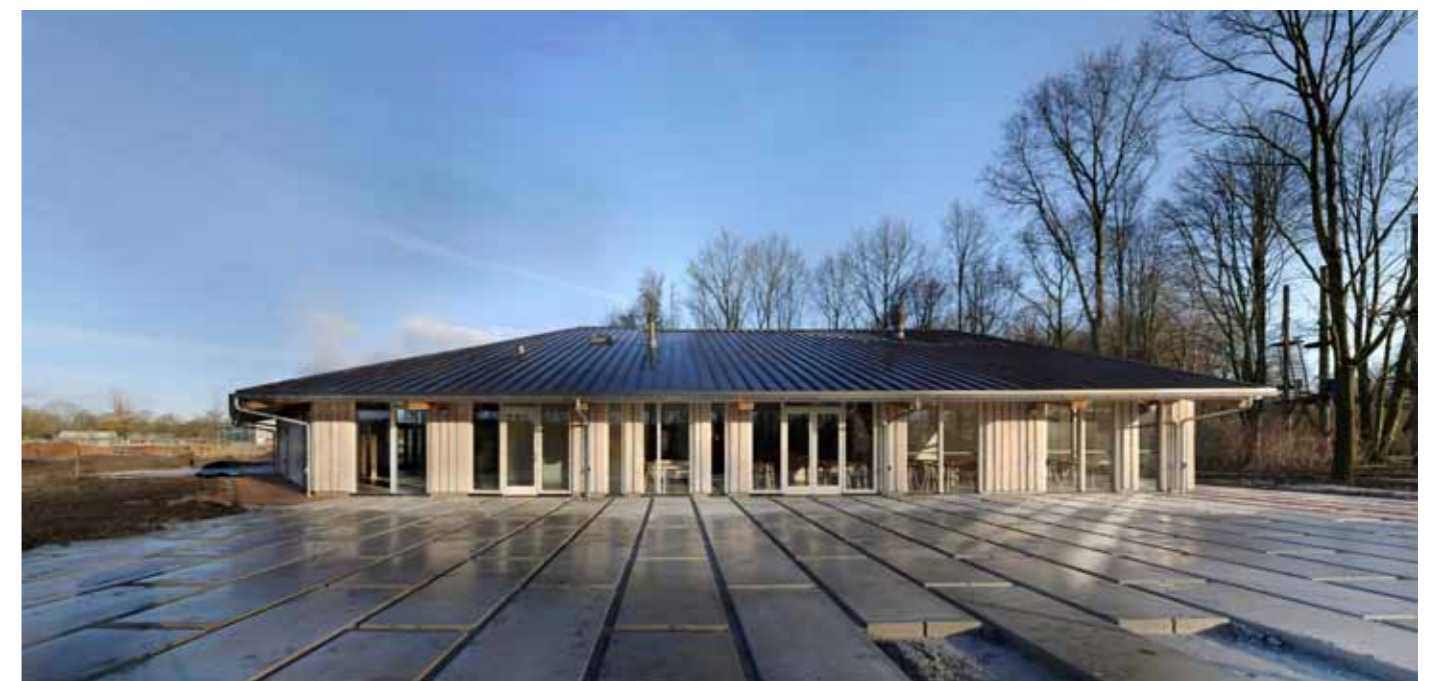
Buitencentrum Almeerderhout 7