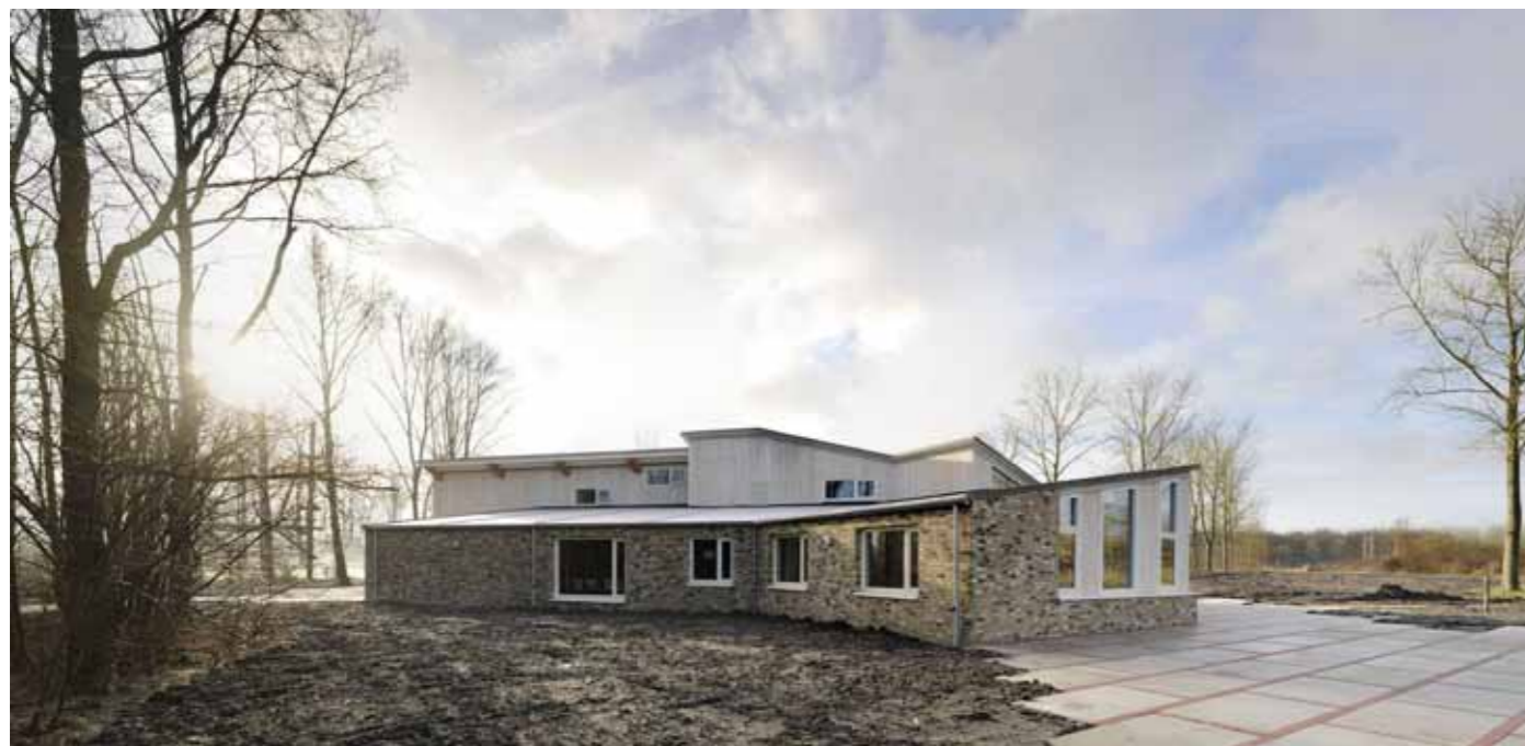
Buitencentrum Almeerderhout 6