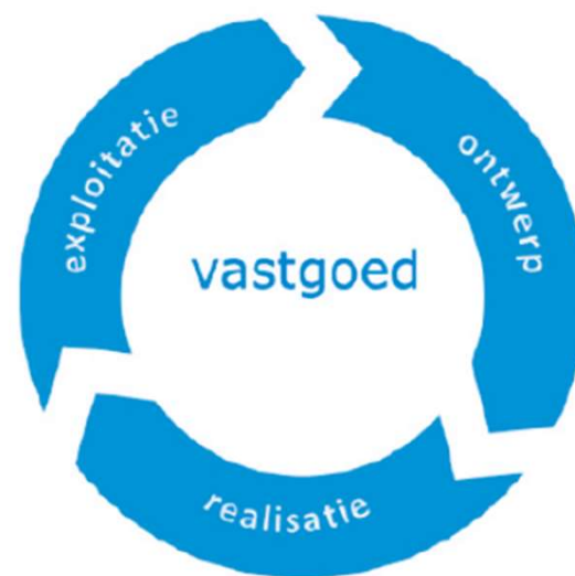
Figuur 1: de volledige levenscyclus van vastgoed, opgesplitst in ontwerp, realisatie en exploitatie.